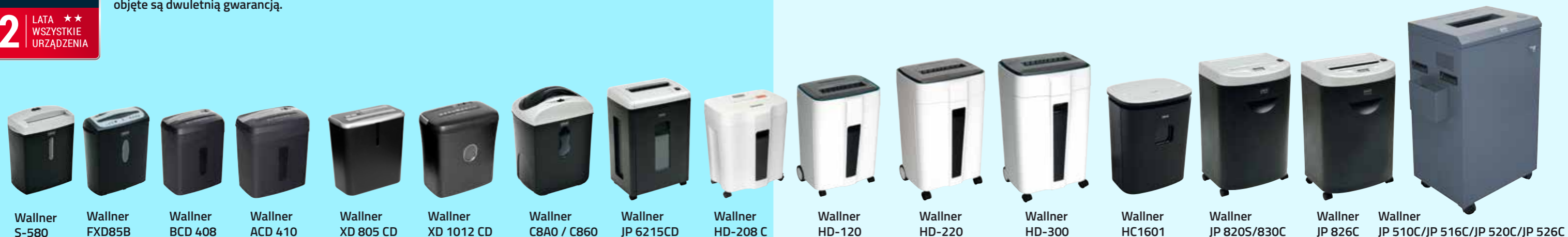
Wallner S-580 Wallner FXD85B Wallner BCD 408 Wallner ACD 410 Wallner XD 805 CD Wallner XD 1012 CD Wallner C8A0 / C860 Wallner JP 6215CD Wallner HD-208 C Wallner HD-120 Wallner HD-220 Wallner HD-300 Wallner HC1601 Wallner JP 820S/830C Wallner JP 826C Wallner JP 510C/JP 516C/JP 520C/JP 526C

Wszystkie niszcarki Wallner objęte są dwuletnią gwarancją.